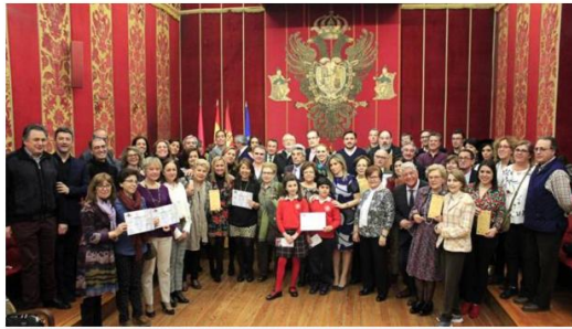
Foto de familia de todos los premiados, ayer, en la Sala Capitular del Ayuntamiento de Toledo

• Entrega de los premios de la XVIII edición del Certamen de Patios