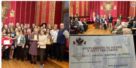
Santiago el Mayor @ColegioSEM